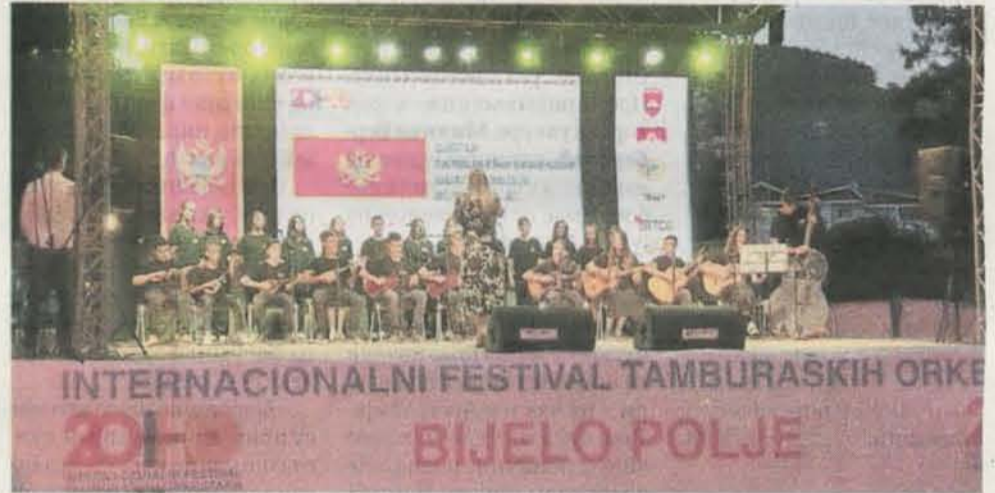
Дјеца тамбураши оправдано покупили симпатије публике