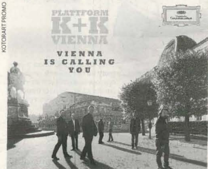
Bečka platforma „K+K“