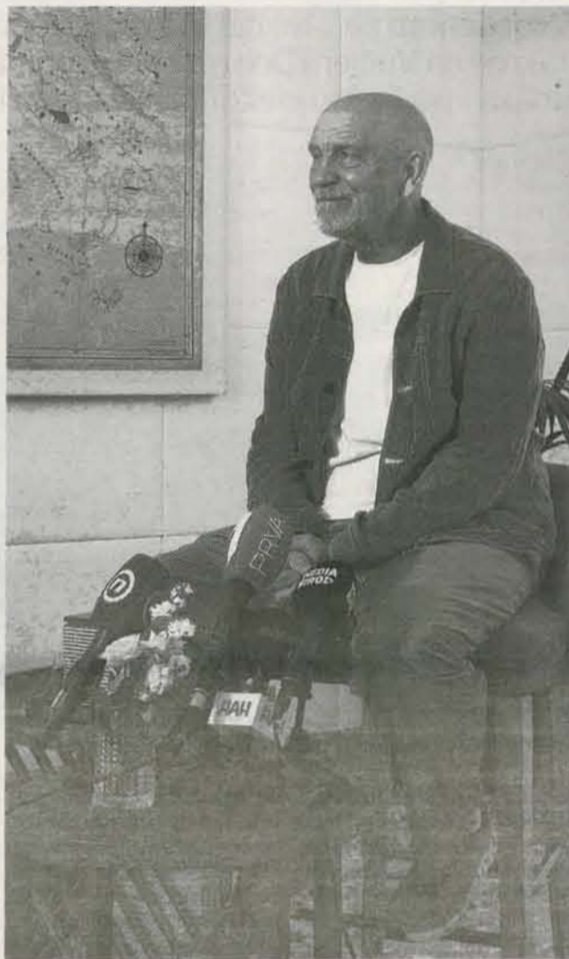
Džon Malkovič juče tokom susreta sa novinarima u Tivtu

- Kada i ako je dobra, umjetnost ima tu moć da mijenja čovjekov život, ili bar perspektivu, način na koji posmatramo stvari. Ono što jeste činjenica je da u ovom djelu mi imamo ta dva različita faktora, suprotstavljene strane. Jedna od njih je neophodnost pokajanja. To može biti pokajanje za djela za koja čovjek želi da nikada nije napravio. Mislim da su ljudi istinski mislili da se Unterveger, moj lik, pokajao. Ipak, nijesam siguran da serijske ubice mogu lako da se pokaju – rekao je Malkovič.