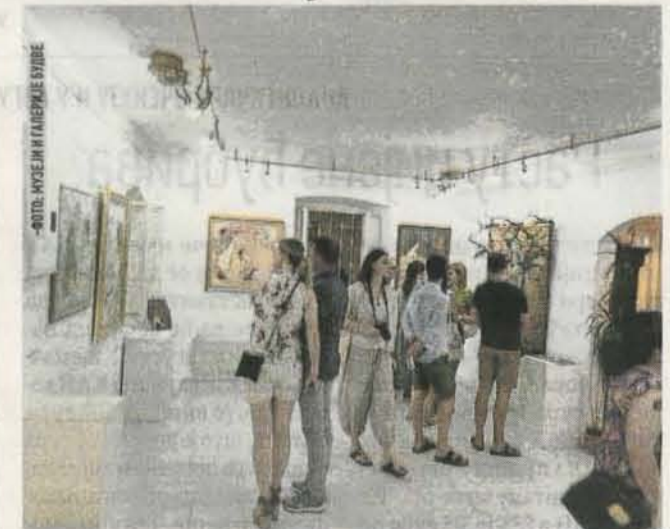
Детаљ с отварања изложбе „Метаноја“