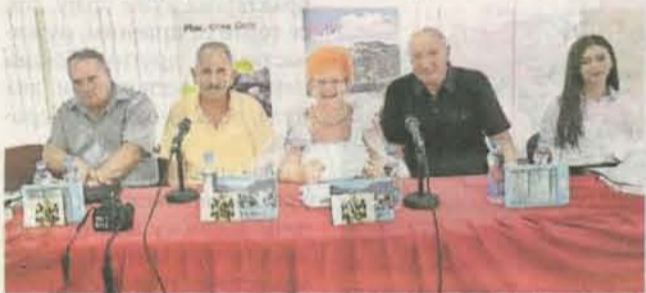
Аутор и промотери