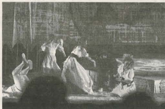
Sa premijernog izvođenja predstave „Dekameron“

BAR – Premijera predstave „Dekameron“, koprodukcije JU Kulturni centar Bar („Barski ljetopis“), Gradskog pozorišta iz Podgorice i Narodnog pozorišta iz Niša, po dramatisaciji Stevana Koprivice, a u režiji Dejana Projkovskog, održana je na Ljetnjoj sceni Doma kulture u Baru.