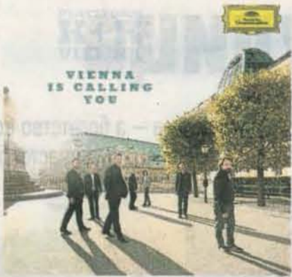
Плакат за концерт

Међународни фестивал Которарт - Дон Бранкови дани музике наставља се вечерас (29. јул) концертом чланова Бечке филхармоније, али у Порто Монтенегро. Музичари окупљени око Бечке платформе К+К свираће од 20 часова у згради бившег Дома Војске, а концерт је насловљен „Vienna Calling!“.