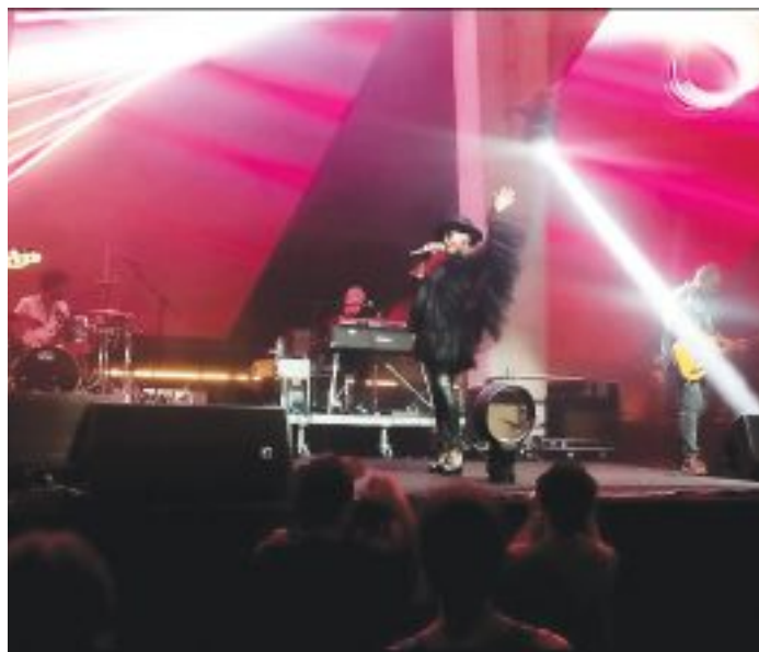
Sa nastupa Morčibe

Umjesto frontmenke (frontman), Skaj je pokazala da je prava "frontwoman" koja posjeduje takvu moć da svojim glasom, nastupom, energijom i šarmom ostvaru povezanost sa svakim pojedincem u publici, a od mase individua stvori zajednicu sa kojom će se izmjestiti sa tla neke teritorije i vinuti ka visinama muzike u kojima se svi savršeno razumiju i (sa)osjećaju. Snažna, jaka, ali i vidljivo skromna, konstantno nasmijana, uz povremene komentare i šale tokom koncerta, djeluje svima bliska, ne usteže se od kontakta očima i komunikacije generalno, te je tako stvorila opuštenu atmosferu punu nježnosti, povremene melanholije, romantike, ali i snage, što su svi prihvatili, neprekidno plesali i bili dovoljno prepušteni trenucima kakve samo muzika